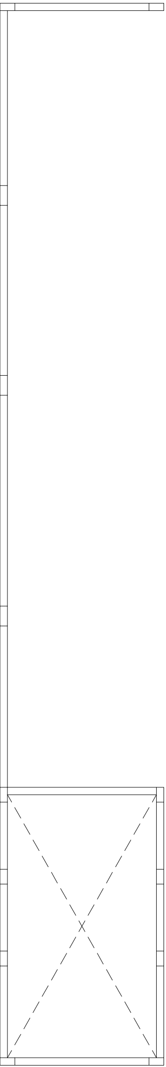
P8, Direito Armadura longitudinal superior Concreto: C25, em geral Escala: 1:50